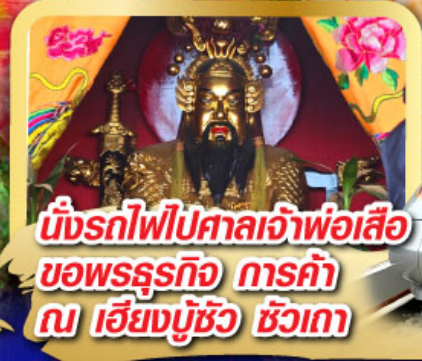
นั่งรถไฟไปศาลเจ้าพ่อเสือ ขอพรธุรกิจ การค้า ณ เชียงมู้อู๋ ชิวเกา