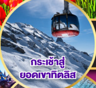
กระเช้าสู่ยอดเขาคิลิส