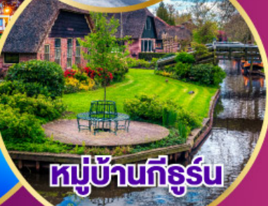
หมู่บ้านทีร์รูน

เดินทาง 30 เม.ย.-09 พ.ค. 68 03-11 พ.ค. 68