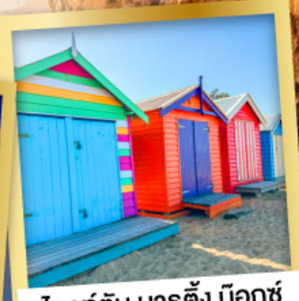
ไบรด์ตัน บาร์ตัง บ็อกซ์

03-10, 12-19 เม.ย.68 24 เม.ย.-01 พ.ค.68 08-15, 22-29 พ.ค.68 29 พ.ค.-05 มิ.ย.68