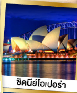
ซิดนีย์โอเปร่า