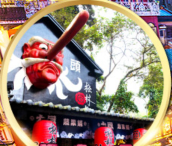
หมู่บ้านปิต่างซีโก