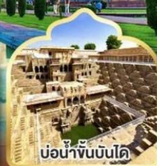
บ่อน้ำจันทันไค