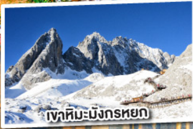
เขาสหิมะมิงกรหยก