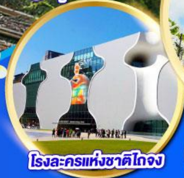
โรงละครแห่งชาติไทจง