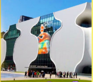
โรตัสตราแห่งชาติไทเป