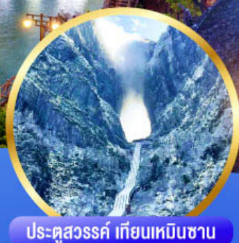
ประตูสวรรค์ เทียนเหมินซาน