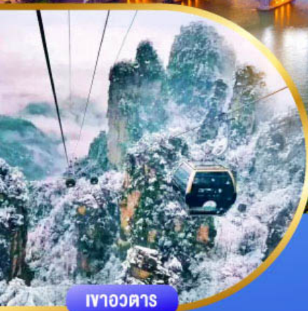
เทาววดตาร