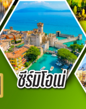
ซีร์มิโอเน่