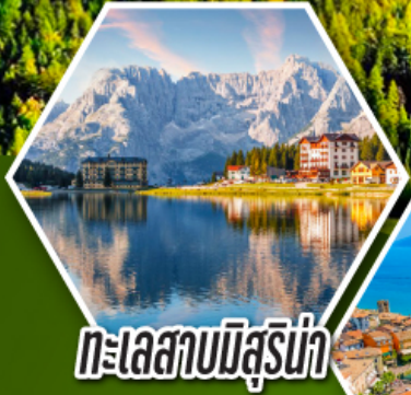
ทะเลสาบมิสร์น่า