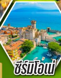
ซีร์มิโอเน่