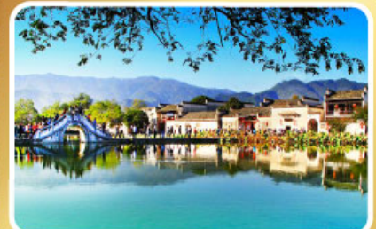
หมู่บ้านผดกโลก หงซุน