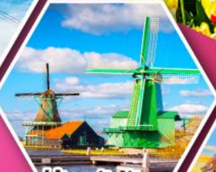
หมู่บ้านกังหันลม ชาสคินส์