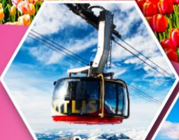
กระเช้าที่ตลีส