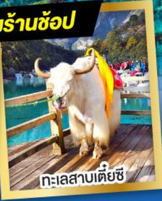
ทะเลสาบเต๋ยซี