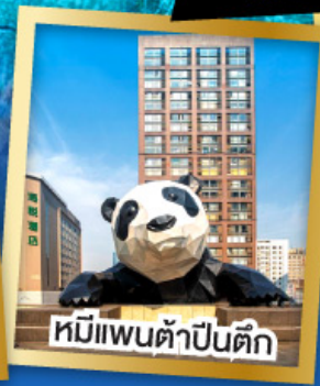
หมีแพนด้าปิ่นตึก