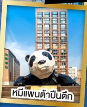
หมีแพนด้าป็นตึก