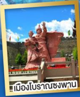
เมืองโบราณชงพาน