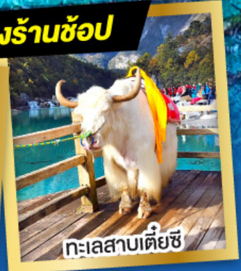
ทะเลสาบเตี้ยชี่