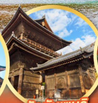
วัดนินเซนจิ