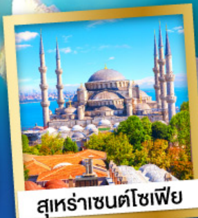
สุหระาเซนตโซเฟีย