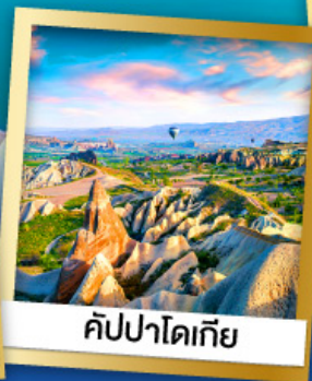
คัปปาโดเกีย