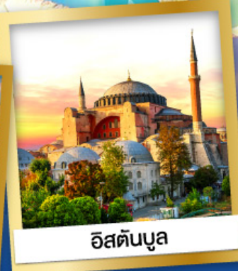
อิสตันบูล