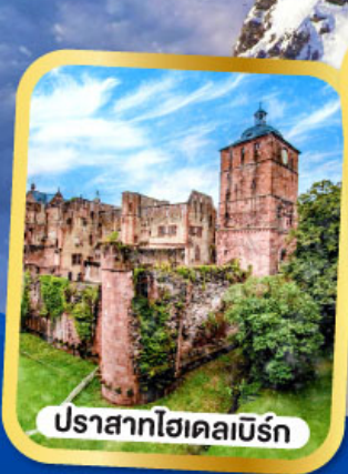
ปราสาทไฮเคิลเบิร์ต