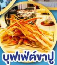
บุฟเฟ่ต์จางู