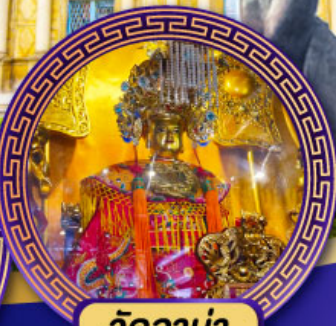
วัดอาม่า