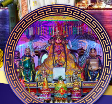
ศาลเจ้าหังเจีย