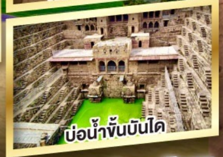
บ่อน้ำขั้นบันได