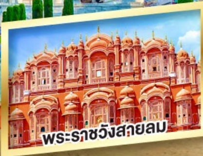
พระราชวังสกายม