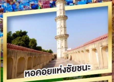
หอคอยแห่งชัยชนะ