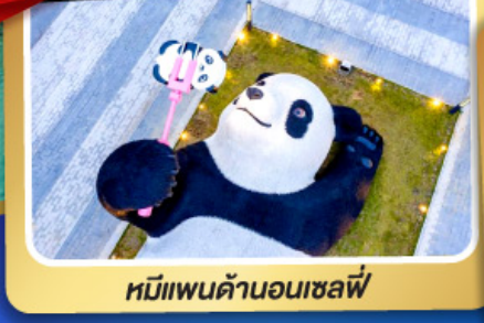
หมีแพนด้าอนเซลฟี