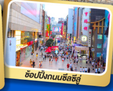
ช้อปปิ้งถนนซีลชีลู