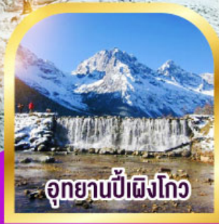
อุทยานป่าผิงโกว