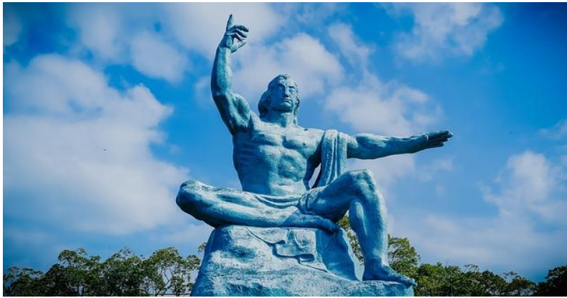
สวนสันติภาพนากาซากิ

นากาซากิ (Nagasaki) เป็นเมืองที่ตั้งอยู่ทางตะวันตกของเกาะคีวชู ประเทศญี่ปุ่น เมืองนี้เป็นที่รู้จักจากประวัติศาสตร์อันยาวนานและวัฒนธรรมที่หลากหลาย เมืองนี้เป็นที่รู้จักจากชายหาดที่สวยงาม อาหารทะเลสด และสถานที่ท่องเที่ยวทางประวัติศาสตร์และวัฒนธรรมมากมาย