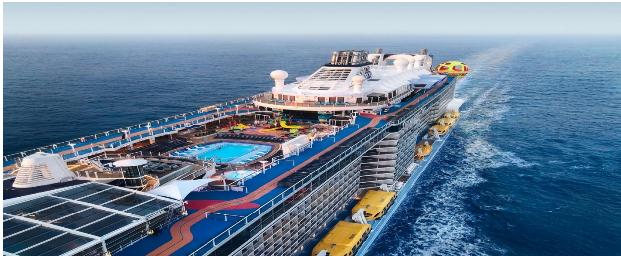
Go Cruise - Spectrum Of The Sesa – QQCRSHA-RCI020 – ( Shanghai-Fukuoka-Nagasaki 6D5N ) – (CRUISE ONLY)

เช้า รับประทานอาหารเช้า ณ ห้องอาหารภายในเรือสำราญ อิสระทุกท่านตามอัธยาศัย