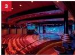
Zodiac Theatre Catch a signature production live show in our opulent theatre.