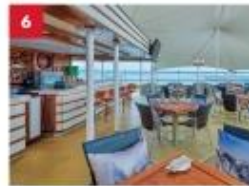
Seafood Grill Enjoy your favourite outdoor hot pot dining with a wide selection of meats, seafood or vegetarian options, paired with an extensive beverage list.