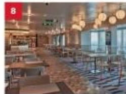
Mozzarella Ristorante & Pizzeria For adventurous foodies, savour a modern fusion of classic Italian dishes and pizzas with a Japanese twist.