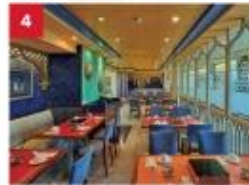
Hot Pot Enjoy your favourite noodles with an extensive list of beverages available to complement your dinner.