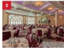
Dream Dining Room Savour Chinese and Western cuisine in our elegant main inclusive dining room.