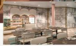
The Little Cake Café Decadent cakes and artisanal chocolates