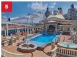
Parthenon Pool Go for a dip in our outdoor Roman-themed pool deck with Caesar's Slide, hot tubs, a stage for live bands and a mega LED screen.