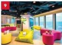
Little Dreamers Club Feed your children's imaginations with games, workshops, costume parties and even a DJ booth at our kids-only club.