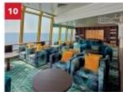
Palm Court Relax in our sophisticated observatory lounge as you enjoy sweeping ocean views.