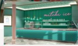
Matcha Ice Popular Matcha ice cream and Taiwan milk tea