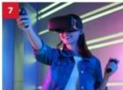
ESC Experience Lab Experience the latest in virtual and augmented reality technology for non-stop thrills.