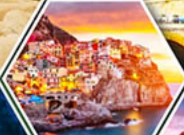
หมู่บ้านมาราโรลา