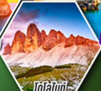
โดโลไมท์

โปรแกรมเดียว เก็บครบจบ อิตาลี ตั้งแต่เหนือถึงใต้