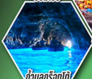
ถ้ำลูกรोटโต้