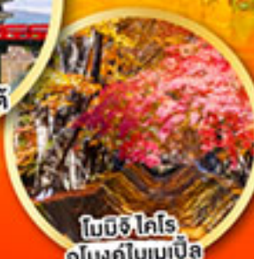
โมมิจิ ไคโร อุโมงค์ไบเมเปิล

เที่ยวเต็มทุกวัน ไม่มีฟรีคีย์ พักออนเซ็น 2 คืน พักโตเกียว 1 คืน บินเจ้านาโกย่า-ออกโตเกียว