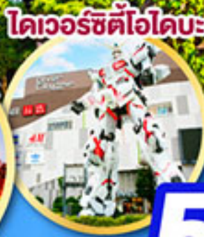
โดเวอร์ซิตีไอบะ