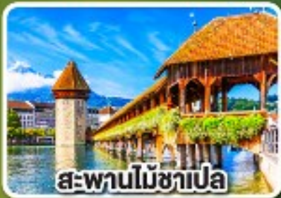
สะพานไม้อาเปิล