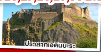
ปราสาทเอดินบะระ