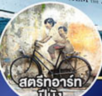
สตรีทอาร์ต ปีนัง