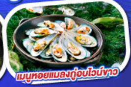
เมนูหอยแมลงภู่อูบไวน์ขาว