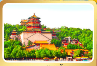
พระราชวังฤดูร้อนอี้เหอหยวน