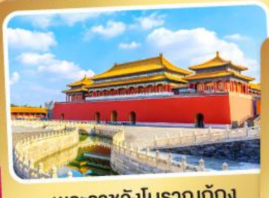
พระราชวังโบราณกู้กง