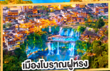
เมืองโบราณฟูหรง