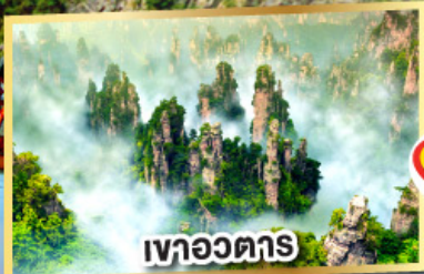
เขาอวดตาร