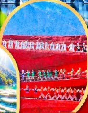
โชว์ Impression Lijiang