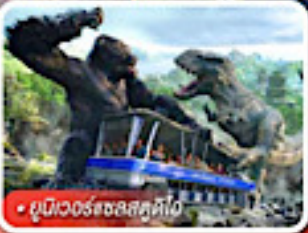
ยูนิเวอร์แซลส์ตูดิโอ