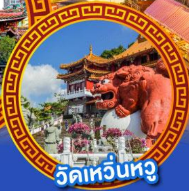
วัดเหวี่ยนหู่