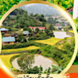
หมู่บ้านก๊ตก๊ต