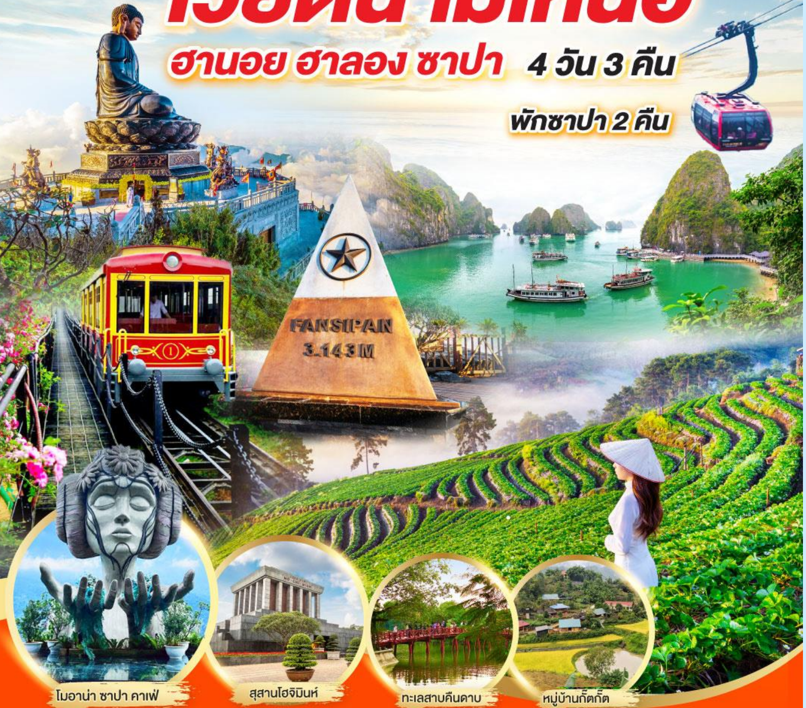
โมนาน่า ซาปา คาเฟ่