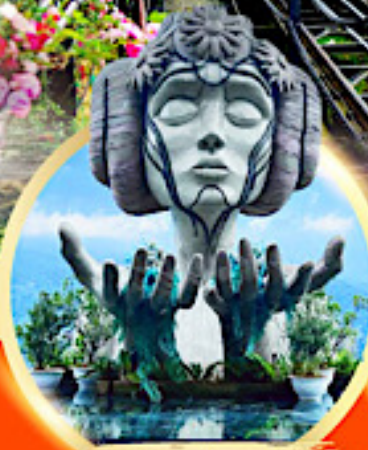
โมนาน่า ซาปา คาเฟ่