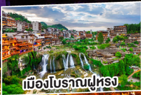
เมืองโบราณผุ่หลง