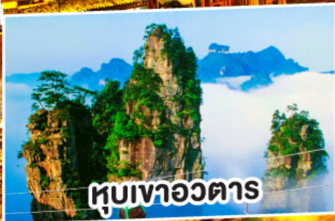
หุบเขาอวตาร