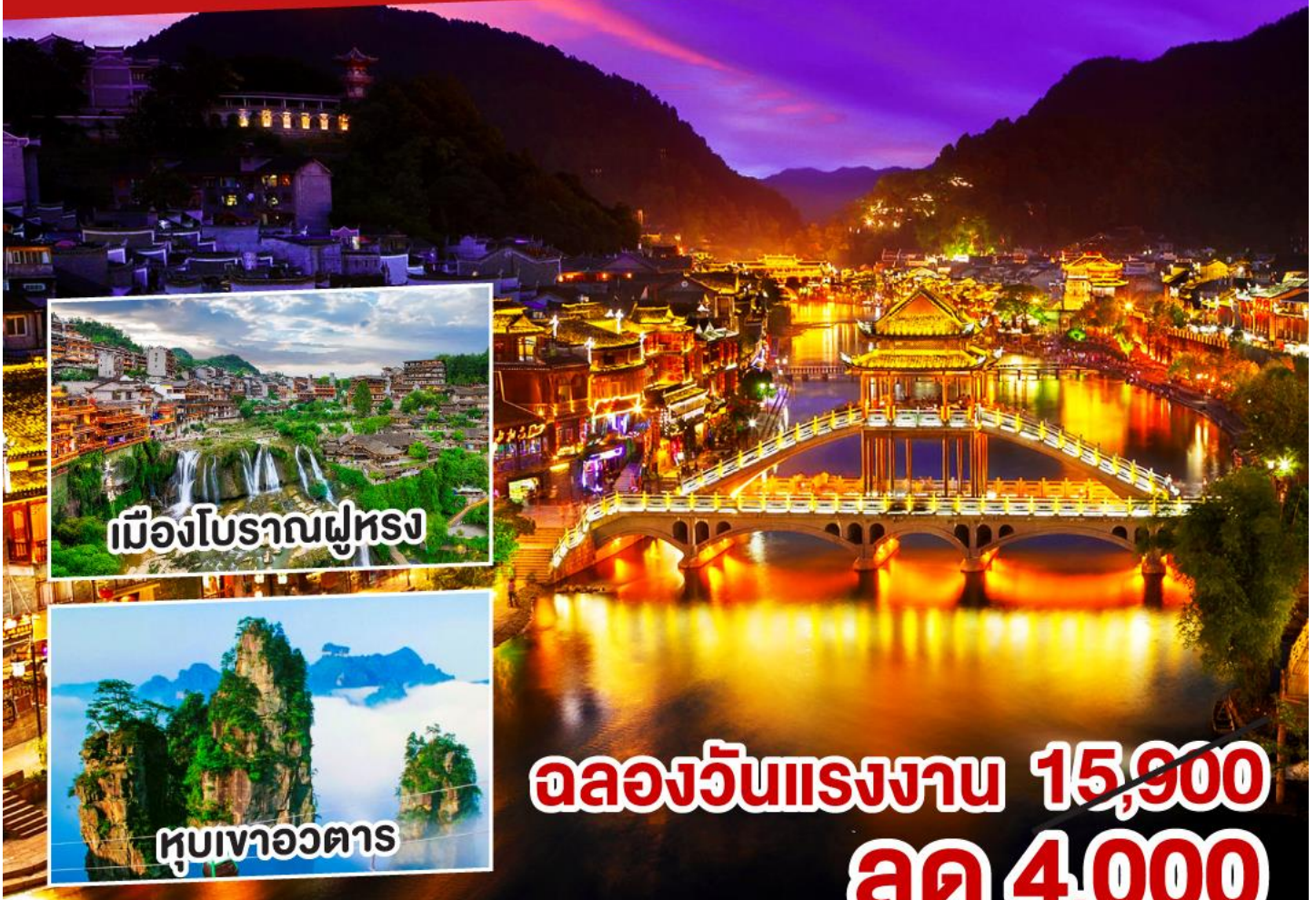
เมืองโบราณผู้ทรง