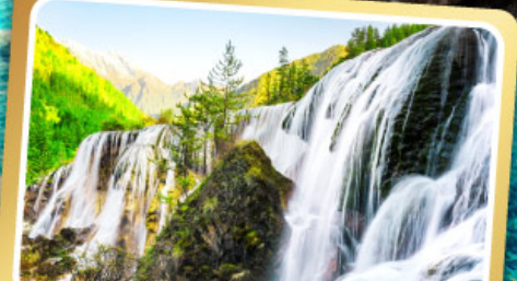
น้ำตกธารโง่บูก

ชมโชว์เปลี่ยนหน้ากาก เมนูพิเศษ สุกี่หม่าล่าเสฉวน