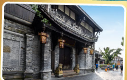
ถนนควานโจ๋เซียงจื่อ