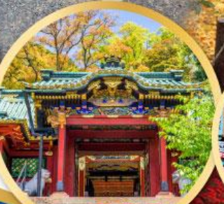
ศาลเจ้าโทโชคุ