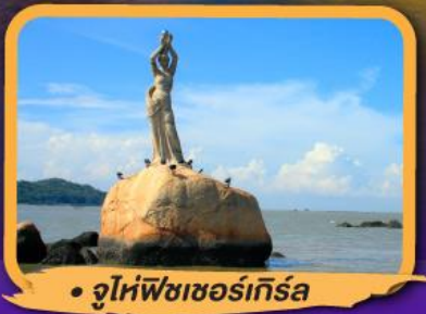
• จูไห่ฟิชเชอร์เทิร์ล