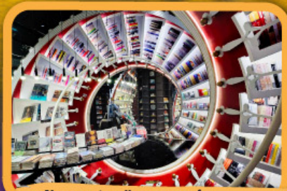
• ร้านหนังสือจิงซูเก้อ