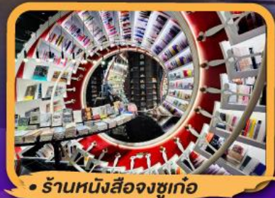
• ร้านหนังสือจงชูก่อ