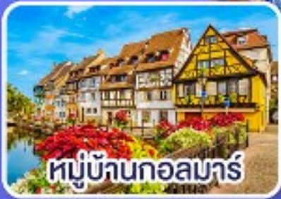
หมู่บ้านกอลมาร์