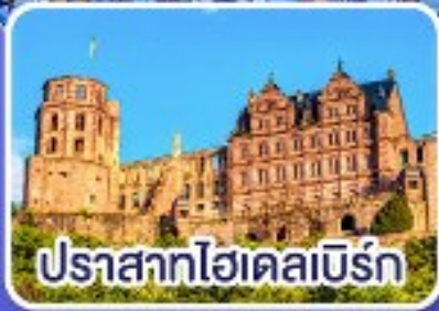
ปราสาทไฮเดิลเบิร์ก