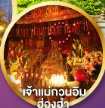
เจ้าแม่กวนอิม ฮ่องกง