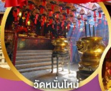
วัดหมื่นโหม่