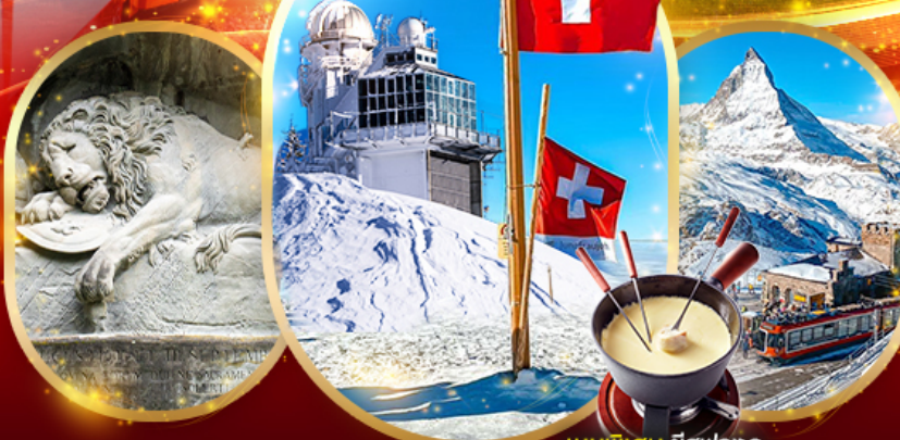
เมนูพิเศษ ชีสฟองดู