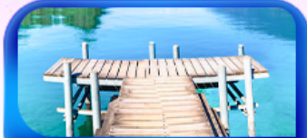
หมู่บ้านอิเซคท์วอลด์