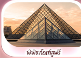
พีพริซกันท์ซูฟร์