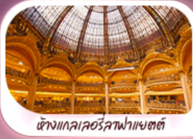
ห้างแกลเลอรีลูฟวร์