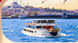
ช่องแคบบอสฟอรัส