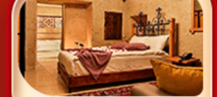
คับปาโดเกีย