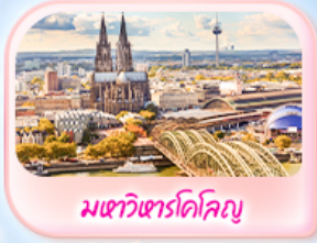
มทาวหารโคโลญ