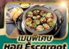
เมนูพิเศษ หอย Escargot