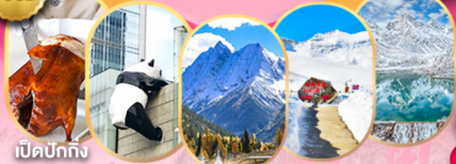
เปิดปิกกิง